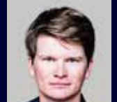
カーステン・ダフィン(ホルン)