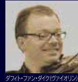
ダフト・ファン・ダイク(ヴァイオリン)