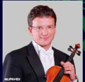
アントン・バラホフスキー(ヴァイオリン)