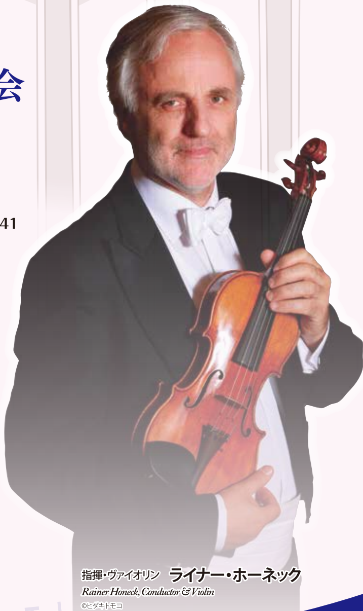
指揮・ヴァイオリン ライナー・ホーネック Rainer Honeck, Conductor & Violin