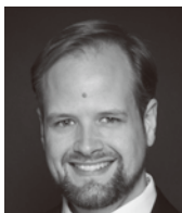
テノール ベンヤミン・ブルーンズ Benjamin Bruns, Tenor

ベルギー出身。2006年ARDミュンヘン国際音楽コンクール第3位。モネ劇場に定期的に出演しているほか、リヨン歌劇場、アン・デア・ウィーン劇場、ローマ歌劇場、英国ロイヤル・オペラ・ハウス、ザルツブルク音楽祭等に出演、ネゼ＝セガン、ヘンヒェン、ブリュッヘンら著名な指揮者との共演も多数。日本では、16年、17年武生国際音楽祭、18年新国立劇場・細川俊夫《松風》の松風役で出演。また15年大野和士指揮・東京都交響楽団創立50周年欧州ツアーのソリストとして細川俊夫《嵐のあとに》を演奏、それに先立ちサントリーホールで世界初演を行っている。