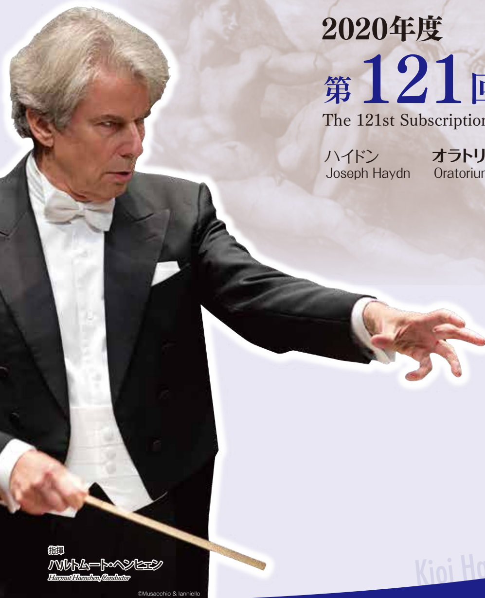
指揮 ハルトムート・ヘンヒェン Harmut Henchen, Conductor

オラトリオ「天地創造」Hob.XXI-2 Oratorium "Die Schöpfung (The Creation)" Hob. XXI:2