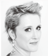
ソプラノ イルセ・エーレンス Ilse Eerens, Soprano

ドレスデン音楽大学を卒業し、1971年ウェーバー指揮コンクールで優勝。ベルリン州立歌劇場常任客演指揮者、オランダ・フィル、オランダ室内オーケストラ首席指揮者、オランダ国立歌劇場音楽監督等を歴任。またベルリン・フィル、ロイヤル・コンセルトヘボウ管、シュターツカペレ・ドレスデン、パイロイト音楽祭などにも客演。2002年から08年まではドレスデン音楽祭音楽監督を務めた。08年音楽と芸術への多大な貢献が認められ、ドイツ連邦共和国の連邦功労勲章を受章。これまでに多数来日し、紀尾井シンフォニエッタ東京(現・紀尾井ホール室内管弦楽団)には03年、05年、09年(メンデルスゾーン《エリア》)、11年(ベートーヴェン《第9》)に続く5回目の客演となる。