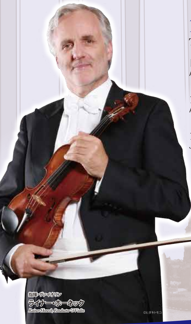
指揮・ヴァイオリン ライナー・ホーネック Rainer Henschl, Conductor & Violin