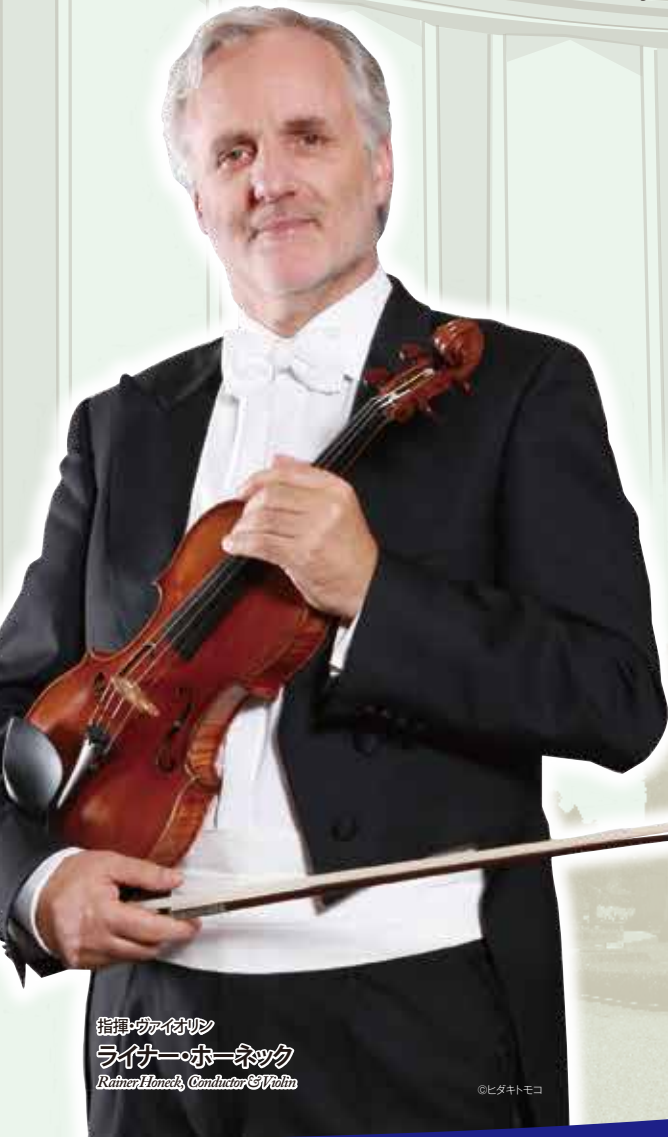
指揮者 ライナー・ホーネック Rainer Honeck, Conductor of Violin