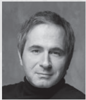
指揮・ピアノ ピョートル・アンデルシェフスキ

鍵盤の詩人にして思索者アンデルシェフスキがKCOに初登場し、モーツァルトのピアノ協奏曲を弾き振りでお届けします。彼がKCOデビューに選んだのは、モーツァルトの27あるピアノ協奏曲のうち、2つしかない短調作品のひとつである第24番と、彼にとって日本初披露となる第12番の2曲。今回指揮者を置かず、彼が自ら弾き振りすることに拘ったのは、KCOのメンバーと室内楽のように一体となった音楽作りを求めたためです。コンサートではこの他、プロコフィエフとアンデルシェフスキの同郷の先輩作曲家であるルトスワフスキ作品もお聴きいただきますが、こちらは指揮なしで。2020年9月の第123回定期で聴衆をあっと言わせた指揮なしKCOの高いポテンシャルが、ここでもいかに発揮されるでしょう。