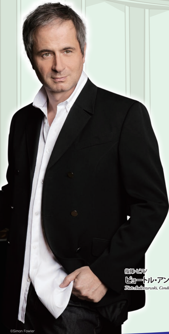
指揮・ピアノ ピョートル・アンデルシェフスキ Piotr Anderszewski, Conductor & Piano