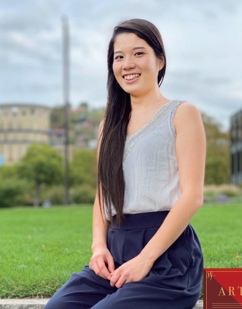
シュトゥットガルト、シュロスパークにて