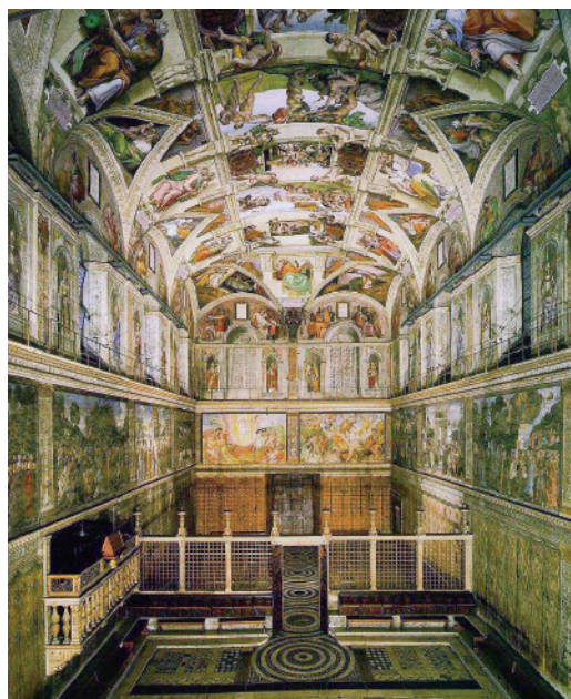
システーナ礼拝堂

はCDなどで楽しみ、ア・カペラを生演奏会で聴ける日を待ちましよう。 文 諸石幸生