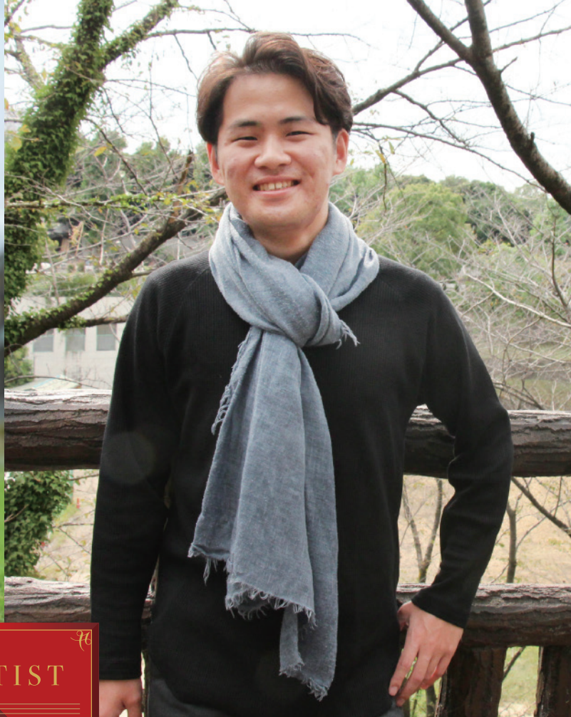
2020年9月 帰国時に紀尾井ホール近くで