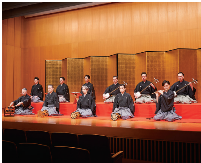
2018年3月6日 「紀尾井 江戸 邦楽の風景(十七) 女形」公演より

冒頭の《謡ガカリ》は能《道成寺》の「 花の外には」の詞章を用いて荘重に始ま りますが、その後は能《三井寺》の詞章を 取り入れた《中啓の舞》や、諸国の廓を詞 章に詠み込んだリズムミカルな《鞠唄》、元 禄期の流行唄を使つた《梅とさんさん》、 後半の《鞆鼓の踊り》《山尽くし》や田植 え唄を交えた《鈴太鼓の踊り》など、さま ざまな唄が次々と繰り出されます。この ような組曲風の構成が《京鹿子娘道成 寺》の大きな特徴になっています。聴きど ころとしては、《中啓の舞》の「初夜の鐘 を撞く時は」のタテ唄の独吟や唄方の声 がたっぷりと味わたる《クドキ》、三味線 の技巧が楽しめる《チンチレンの合方》